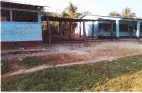
Foto 1: Galera existente para uso de cocina, (cambio de entechado y estructura metálica)