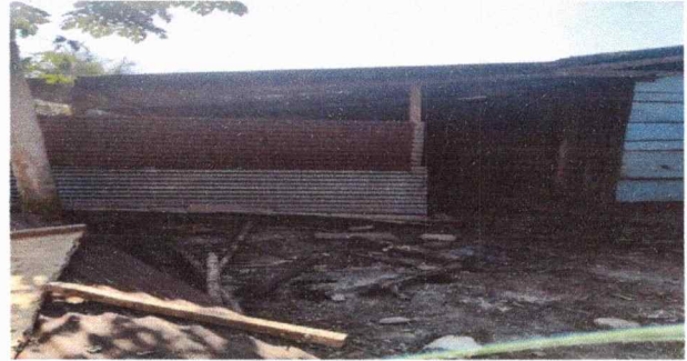
Foto 2: Las condiciones en que se encuentra no es un lugar adecuado para preparar alimentos para los niños