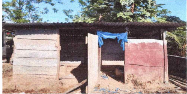
Foto 4: Las condiciones de los sanitarios es lamentable para los niños del centro educativo