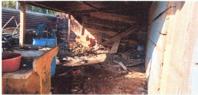
Foto1: En esta fotografía se observa el deterioro en que se encuentra la cocina